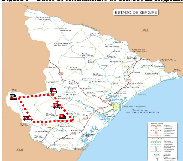
Figura 3 – Bases de Atendimento do SAMU, na Regional de Lagarto

A implantação do novo campus de saúde auxiliará na estruturação do modelo assistencial de saúde da região, que compreenderá um conjunto de ações e serviços hierarquizados, regionalizados e municipalizados, mas com participação do estado nesse modelo, com articulação entre eles. Buscar-se-á a integralidade das ações, a racionalização dos recursos, e a garantia do acesso universal e prioritário ao Sistema Único de Saúde (Lei 8080/90). Essas ações deverão ser desenvolvidas através de uma rede integrada/participativa entre os serviços públicos e toda a rede do SUS, com efetiva participação dos conselhos de saúde (Lei 8142/90). Conselhos esses que se constituem em uma forma de participação popular na gestão do SUS, na construção de uma sociedade justa e solidária e na consolidação da Reforma Sanitária brasileira. Alguns fatores justificam o aprimoramento desse Sistema - se considerados os princípios doutrinários e organizativos do SUS e as atribuições e responsabilidades consolidadas nos termos dos Pactos pela Vida, em defesa do SUS e de Gestão (BRASIL, 2006). Seriam eles: