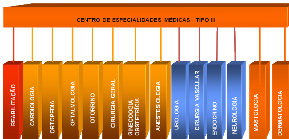
Figura 2 – Eixos de atenção no Centro de Especialidades Médicas

O novo Hospital Regional, que estará vinculado aos cursos do Centro Campus de Ciências da Saúde de Lagarto – UFS, oferecerá atendimento à comunidade dispondo de toda equipe profissional e estrutura de suporte diagnóstico: