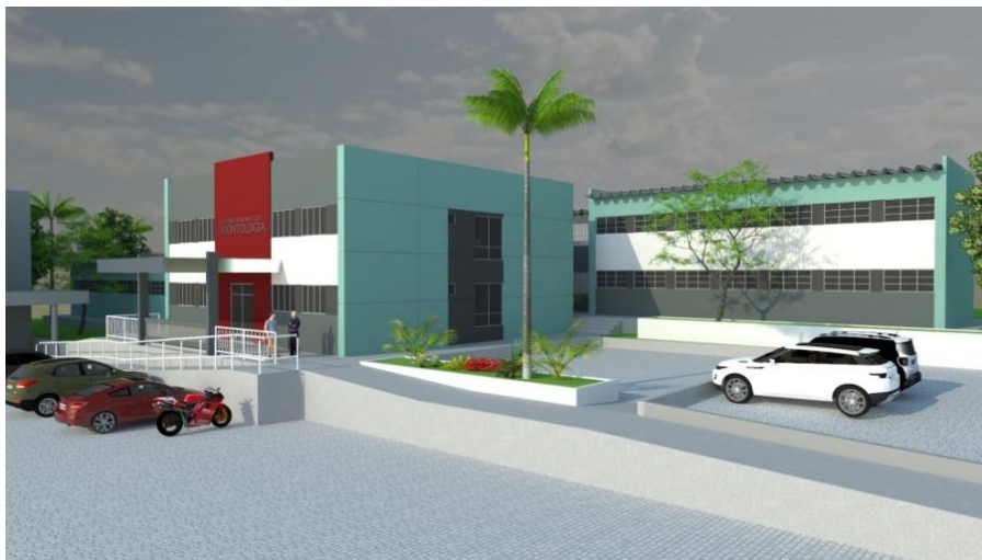
Imagem 01: Perspectiva Artística do Departamento de Odontologia. HU – Hospital Universitário (UFS – Universidade Federal de Sergipe).

Contratação de empresa especializada para execução dos serviços de Reforma para Reforço Estrutural dos Ambulatórios (Infantil e Adulto), Bloco 03 (Sala de Espera / Raio X / Atendimento) do Departamento de Odontologia do Hospital Universitário / Universidade Federal de Sergipe, Aracaju/SE , previstos nas especificações presentes, devendo os mesmos serem entregues totalmente concluídos e em perfeitas condições de uso e funcionamento.